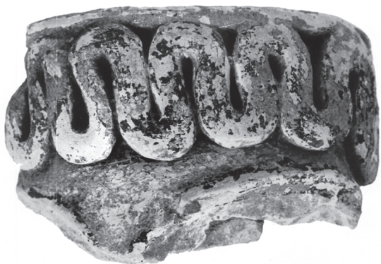
Εικ. 10.1 (αριστερά). Άνω τμήμα κεφαλιού Μυκηναϊκού πήλινου ειδώλιου μεγάλων διαστάσεων.