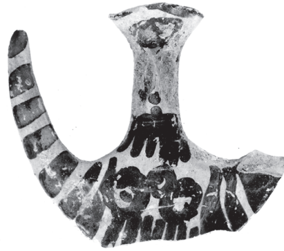
Είκ. 10.4 (επάνω). Μυκηναϊκό πήλινο ειδώλιο τύπου Ψ.

καστανής βαφής. Το δεύτερο θραύσμα είναι ένα χέρι με τον καρπό και τα δάχτυλα, που κρατά το πόδι μιας κύλικας (ΕΙΚ. 10.2 α-β). Έχει διαστάσεις 0,045 μ. μήκος και 0,026 μ. ύψος (χωρίς την κύλικα). Πρέπει να ανήκει σε μεγάλο τροχήλατο ειδώλιο. Επάνω στο χέρι διακρίνεται μικρό τμήμα από το σώμα φιδιού, που προχωρεί προς την κύλικα για να πιει πιθανώς από το περιεχόμενό της. Εξαιρετικό είναι το πλάσιμο του χεριού, κυρίως των δαχτύλων, που κρατούν σταθερά και σφιχτά την κύλικα. Μεγάλες επιφάνειες του χεριού είναι ολόβαφες, όπως και το σώμα του φιδιού, ενώ τα δάχτυλα τονίζονται με γραπτές ταινίες, όπως τα δάχτυλα άλλων Μυκηναϊκών τροχήλατων ειδωλίων από τις Μυκήνες, την Τίρυνθα και τη Μιδέα. 24 Τα δυο αυτά εντυπωσιακά έργα χρονολογούνται στην προχωρημένη Υστεροελλαδική ΙΙΒ περίοδο, όπως προκύπτει από το στενό μέτωπο και τη γραμμή των φρυδιών του κεφαλιού, που θυμίζουν το γνωστό κεφάλι θεάς από λευκό κονίαμα και άλλα ειδώλια της ίδιας εποχής από το Θρησκευτικό Κέντρο των Μυκηνών, καθώς και από το σχήμα της κύλικας. 25 Πρέπει να αποδίδουν θεϊκές μορφές, όπως δείχνουν ο πόλος και το φίδι που συνδέονται με τη θεότητα. Ομοιώματα φιδιών βρέθηκαν άλλωστε στο Ναό των Μυκηνών, μαζί με τα μεγάλα τροχήλατα ειδώλια των γυναικείων θεοτήτων. 26