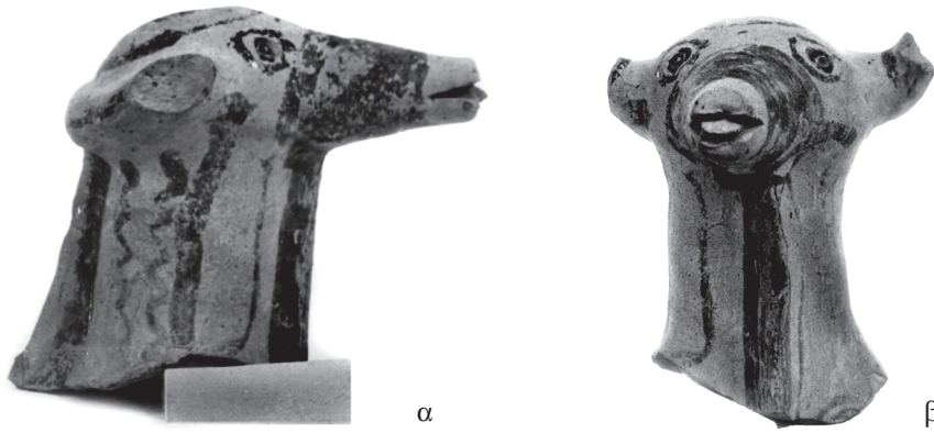
Εικ. 10.6 α-β. Κεφάλι Μυκηναϊκού πήλινου τροχήλατου ζωόμορφου ειδωλίου.