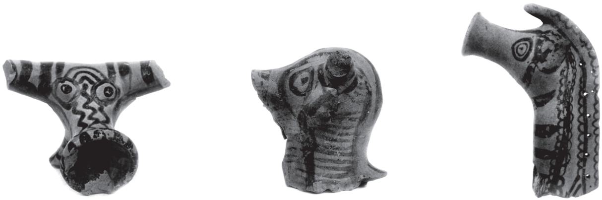
Εικ. 10.7. Κεφάλι Μυκηναϊκού πήλινου τροχήλατου ζωόμορφου ειδωλίου.