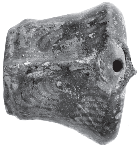
Εικ. 10.11. Κορμός Μυκηναϊκού πήλινου τροχήλατου ζωόμορφου ειδωλίου.

Όπως φαίνεται από τα ευρήματα, το ιερό ιδρύεται προς το τέλος του 13 ου και διατηρείται έως το τέλος του 11 ου αιώνα π.Χ. Τα αντικείμενα που συνδέονται με τη λειτουργία του είναι αποκλειστικά πήλινα. Τα σημαντικότερα είναι τα δύο θραύσματα του πήλινου αγάλματος και του μεγάλου τροχήλατου ειδωλίου (ΠΙΝ. 10.1-2),