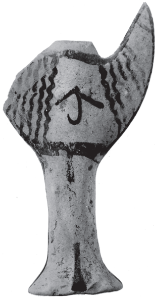
Είκ. 10.3 (αριστερά). Μυκηναϊκό πήλινο ειδώλιο τύπου Ψ.