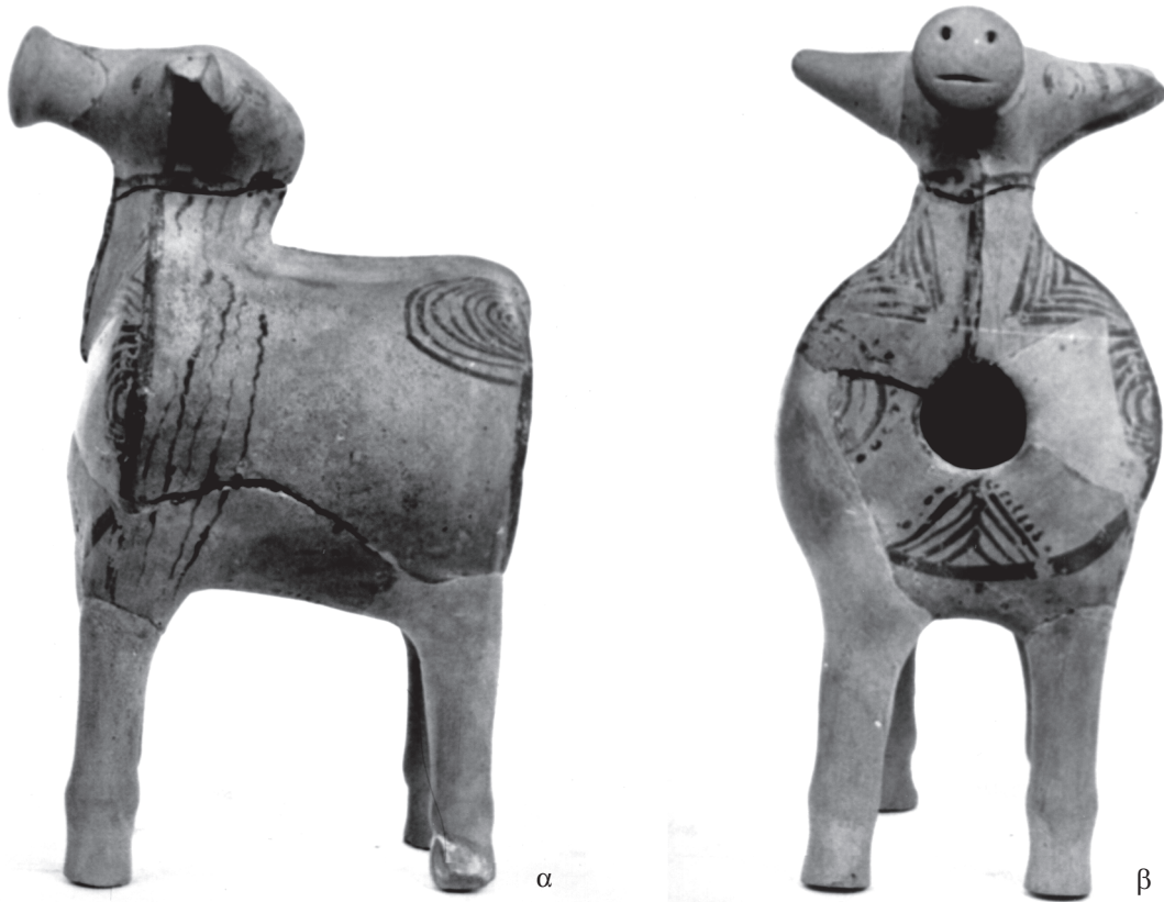
Εικ. 10.10 α-β. Μυκηναϊκό πήλινο τροχήλατο ζωόμορφο ειδώλιο.

Εκτός από τα ειδώλια, βρέθηκαν και λίγα Μυκηναϊκά όστρακα της Υστεροελλαδικής ΙΙΓ περιόδου, από τα οποία σπουδαιότερα είναι ένα θραύσμα σκύφου με διακόσμηση του Πυκνού Ρυθμού, πιθανότατα εισηγμένου από την Αργολίδα, καθώς και θραύσμα κρατήρα με εικονιστική διακόσμηση σκηνής μάχης. 59 Και τα δύο χρονολογούνται στη μέση φάση της Υστεροελλαδικής ΙΙΓ. Υπάρχουν ακόμη μερικά πόδια κυλίκων με γραπτές ταινίες ή αυλακώσεις της ύστερης φάσης της ίδιας περιόδου ή της Υπομυκηναϊκής. 60 Η διακόσμηση του οστράκου του σκύφου, καθώς και μερικών τροχήλατων ζωόμορφων ειδωλίων του Αμυκλαίου κατά τον Πυκνό Ρυθμό ή με άλλα διακοσμητικά θέματα τυπικά στα Αργολικά, Αττικά και Κυκλαδικά αγγεία, δείχνει ότι το ιερό, όπως η Πελλάνα και μερικές ακόμη Λακωνικές θέσεις, είχε επαφές με την Αργολίδα και άλλες περιοχές του Μυκηναϊκού κόσμου, προφανώς μέσω του σημαντικού λιμανιού της Επιδαύρου Λιμηράς. 61