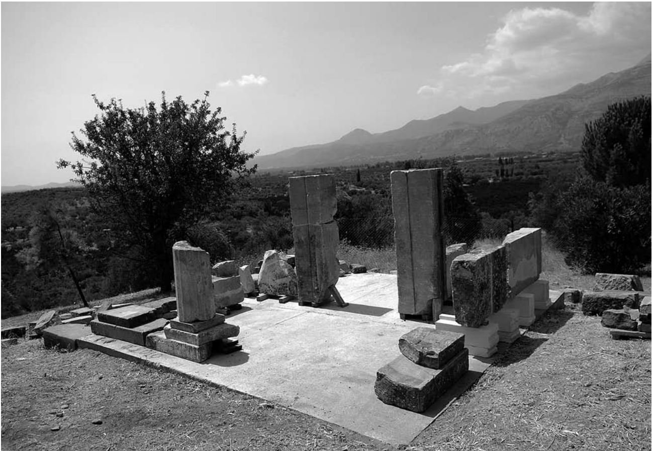
Εικ. 4. Το κάτω τμήμα ενός δωρικού κίονα του Θρόνου που τοποθετήθηκε σε μια βαθμίδα του στυλοβάτη.

3. δύο σύνολα από κορωνίδες με δύο και τρία θραύσματα αντιστοίχως, 4. γείσο από τέσσερα θραύσματα που συγκολλήθηκαν το 2010 και ένα μαρμάρινο συμπλήρωμα, 5. αποκαταστάθηκαν, επιπλέον, μερικώς με συμπληρώματα από νέο υλικό τρεις βαθμίδες του κυκλικού κλιμακωτού Βωμού.