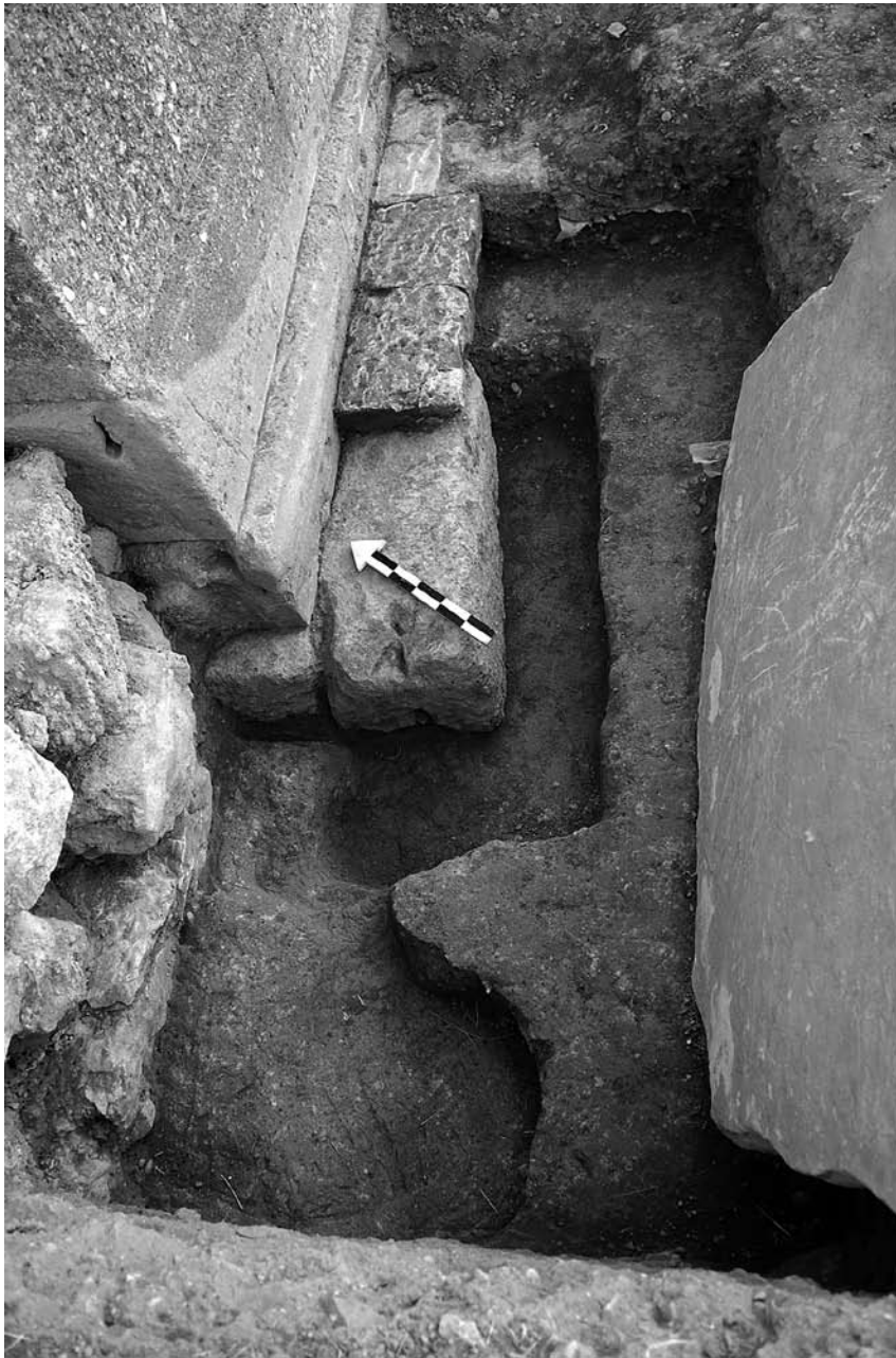
Εικ. 3. Όρυγμα σε σχήμα Γ από τη θεμελίωση του αρχαϊκού περιβόλου.

Πραγματοποιήθηκαν δοκιμαστικές τομές στη νοτιοδυτική πλευρά του μνημειακού περιβόλου-αναλημματικού τοίχου (τετράγωνα Α2, 3 και 6). Οι εργασίες αυτές κρίθηκαν αναγκαίες για την πλήρη αποκάλυψη της δομής του τοίχου, της τάφρου θεμελίωσης, της επιφάνειας