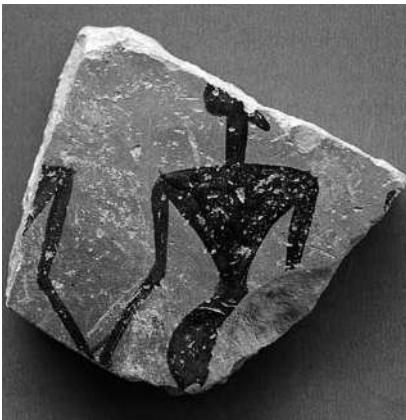
Εικ. 6. Όστρακο γεωμετρικής εποχής με ανδρική μορφή από παράσταση χορού (φωτ.: Στ. Βλίζος).

εκεί μετά τη διάλυση των μνημείων του ιερού.