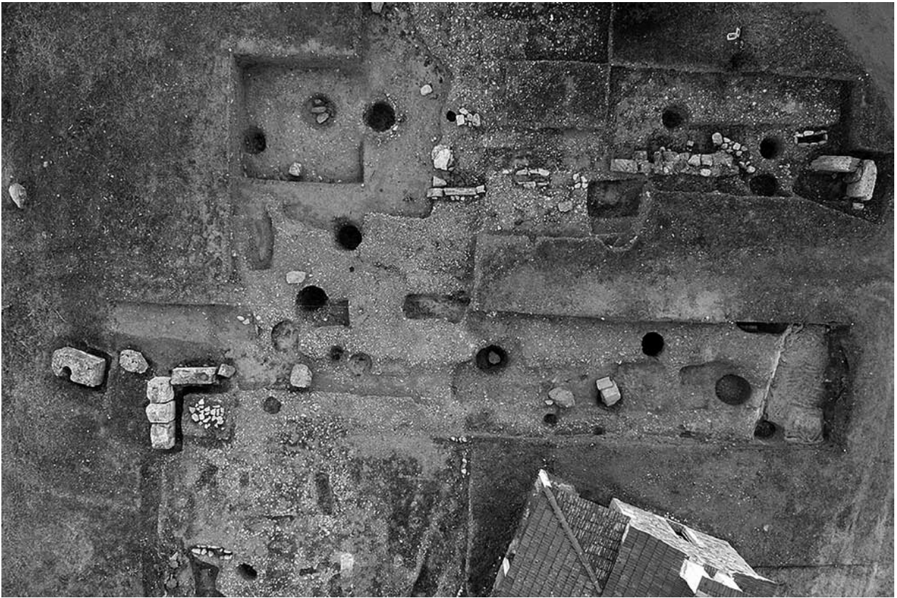
Εικ. 5. Χώρος διερεύνησης της επιφάνειας του λόφου της Αγίας Κυριακής για τον εντοπισμό λαξευμάτων θεμελίωσης του Θρόνου.