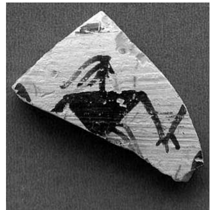
Εικ. 2. Όστρακο γεωμετρικής εποχής με ανδρική μορφή από παράσταση χορού.

Με στόχο τη μελλοντική εργαστηριακή ανάλυση, την τελική μελέτη και την επίλυση ζητημάτων