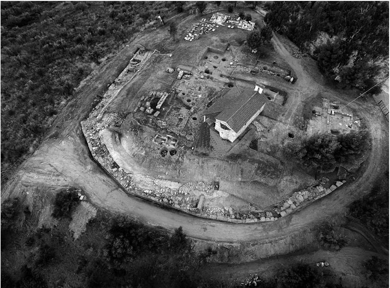
Εικ. 9. Αεροφωτογραφία του λόφου της Αγίας Κυριακής από ανατολικά.

απότμημα λαβής αρχαϊκού κρατήρα ή πίθου με ανάγλυφο διάκοσμο μαιάνδρων. Παράλληλα, αποκαλύφθηκαν ορισμένοι ορθογώνιοι κροκαλοπαγείς δόμοι της εξωτερικής πλευράς του περιβόλου και εσωτερικά ένας σωρός αργών λίθων μετρίου μεγέθους. Ο λιθοσωρός αυτός δεν αποκλείεται να σχετίζεται με το “γέμισμα” της εσωτερικής πλευράς του περιβόλου, δεδομένου ότι μετά την απομάκρυνσή του αποκαλύφθηκε η τεχνητά λαξευμένη, ισχυρά επικλινή επιφάνεια του φυσικού βράχου, καθώς και οι κατά μήκος συστημα-