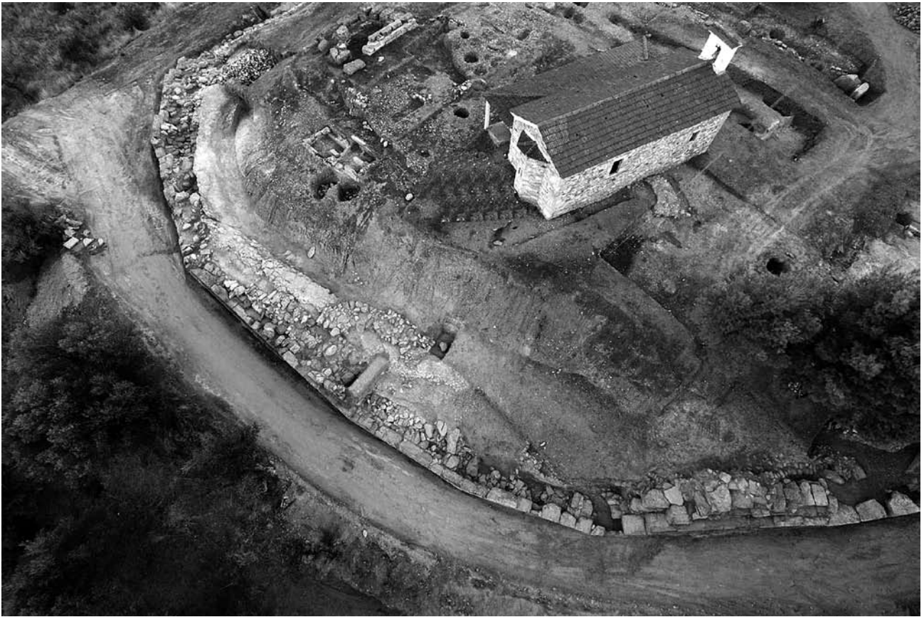
Εικ. 7. Η ανατολική κλιτύς του λόφου της Αγίας Κυριακής μετά την πλήρη αποκάλυψη του αρχαίου περιβόλου.