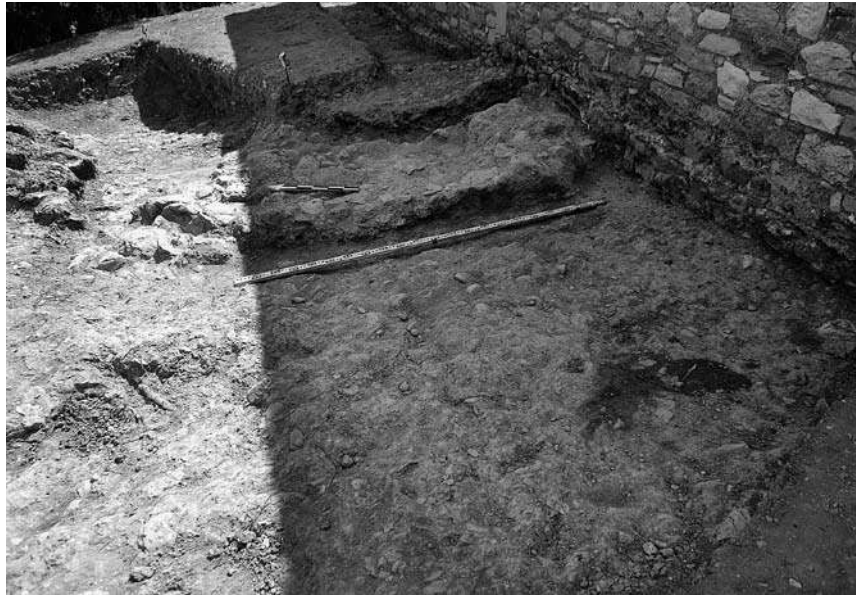
Εικ. 1. Το δυτικό τμήμα της θεμελίωσης μιας αφίδας.

Στα τετράγωνα Ζ3-4 εντοπίστηκαν δύο κατεστραμμένες ταφές από τις οποίες η μια σώζει εν μέρει τοιχώματα με αργούς λίθους, ενώ η άλλη –στο μέσο του νοτίου ορίου του τετραγώνου Ζ3– θραύσματα από αρχιτεκτονικά μέλη του Θρόνου (δοκίδες και ορθοστάτες). Στην ίδια περιοχή ανασκάφηκαν επιπλέον πέντε κυκλικά ορύγματα κενά, όμοια