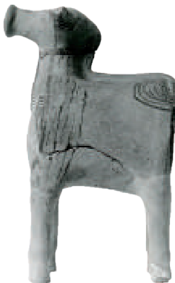
13 Τροχήλατο ειδώλιο βοοειδούς με γραμμική διακόσμηση, από τις ανασκαφές Τσουντα. Μουσείο Μπενάκη 11–12 (2011–2012), σ. 110.