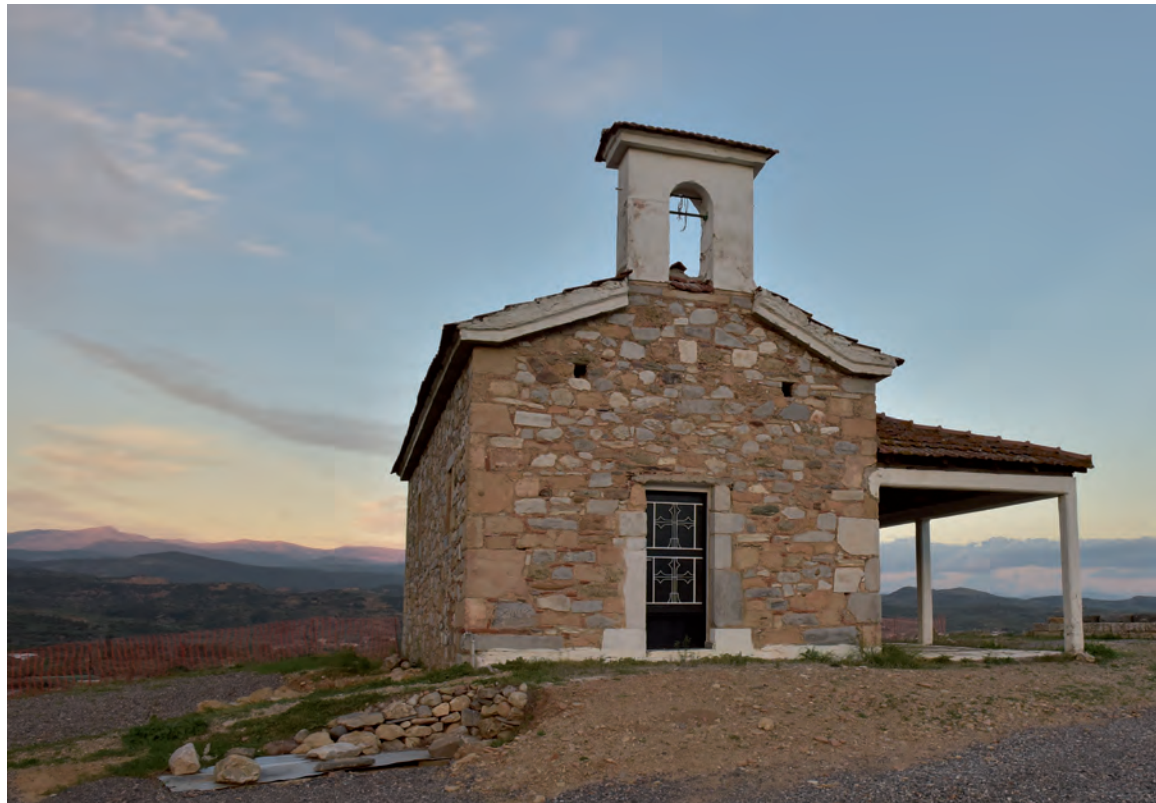
12 Η εκκλησία της Αγ. Κυριακής στην κορυφή του ομώνυμου λόφου.

τρευτικού αγάλματος. Αξίζει να τονιστεί ότι το βάθρο απέκτησε μια συγκεκριμένη υπόσταση χάρη στη σωστή ερμηνεία ορισμένων δόμων τεραστίου μεγέθους από τον Μανόλη Κορρέ, τους οποίους κακώς είχαν αποτιμήσει οι Fiechter και Massow ως απροσδιόριστα δομικά στοιχεία (εικ. 6). Τα μνημειακά αυτά έργα, ξόανο και περίβολος, είχαν ως αποτέλεσμα τη διάλυση των παλαιότερων κατασκευών και τη χρήση του υλικού αυτού για την πλήρωση του κενού μεταξύ λόφου και περιβόλου. Ο μεγάλος όγκος αργών λίθων που βρέθηκε στη νοτιοανατολική γωνία του περιβόλου πρέπει να σχετίζεται με το υλικό αυτό.