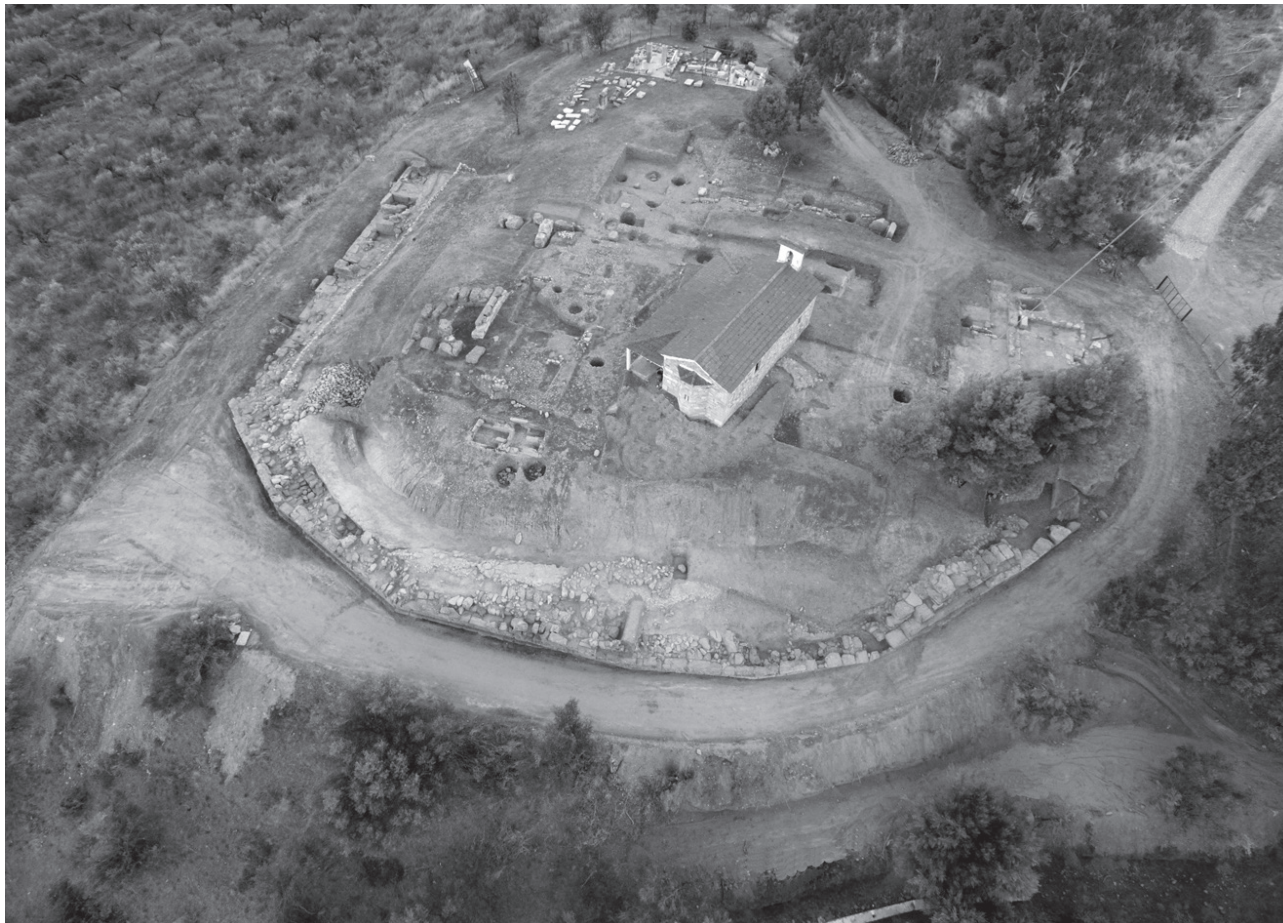
Εικ. 51. Αμύκλες. Ιερό του Αμυκλαίου Απόλλωνα. Η ανατολική πλευρά του Αμυκλαίου, όπου έχει αποκαλυφθεί η δομή των μνημειακών περιβόλων-αναλημματικών τοίχων προς Β..