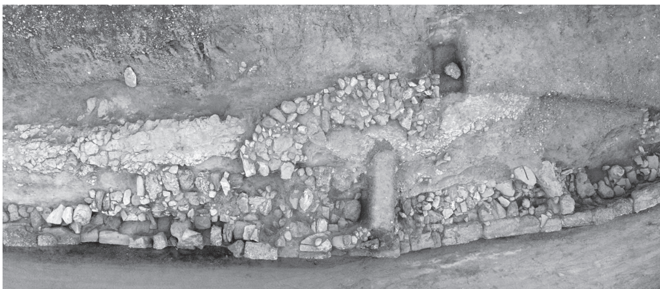
Εικ. 52. Αμύκλες. Ιερό του Αμυκλαίου Απόλλωνα. Το βόρειο πέρας του γεωμετρικού αναλημματικού περιβόλου, όπου ο τοίχος κάμπτεται έντονα προς Δ..