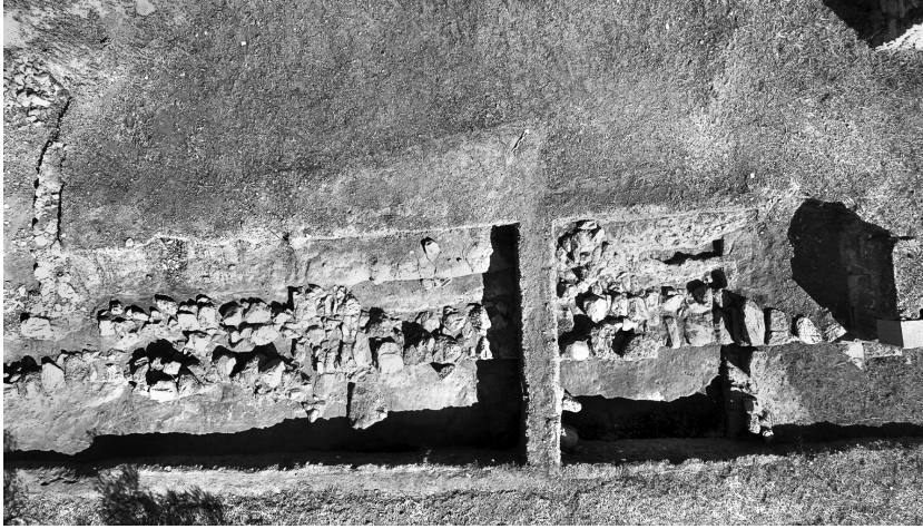
Ἀμύκλαι. Ἡ νότια πλαγιά τοῦ λόφου τῆς Ἁγίας Κυριακῆς μετὸν ὑπὸ διερεῦνηση χώρο.