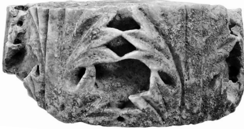
Μπρεξίτζα Μαραθῶνος. Τμήμα κορινθιακοῦ κιονοκράνου.

ἐπὶ τοῦ ὁποίου βρέθηκαν θραύσματα πλακῶν ὀρθομαρμάρωσης καὶ τμήματα κονιαμάτων με χρώματα, ἔντονο ἐρυθρὸ καὶ ὑπόλευκο, ὡς καὶ κεραμίδες λακωνικῆς καὶ θραύσματα χρηστικῶν ἀγγείων καὶ μαγειρικῶν σκευῶν, ποὺ ὀρίζουν καὶ τὴ χρῆσιν τῶν χώρων.