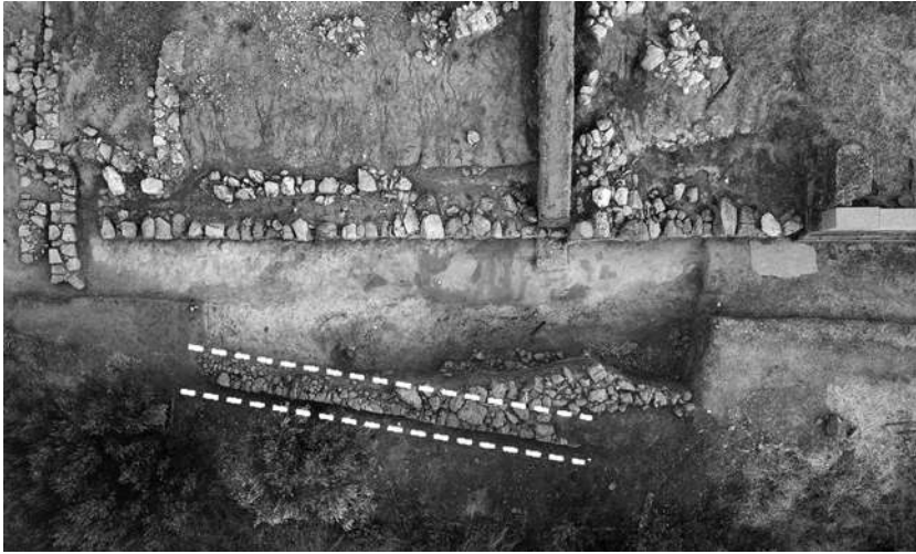
Ἀμύκλαι. Ἡ ΝΔ. πλαγιά τοῦ λόφου τῆς Ἁγίας Κυριακῆς μετὰ τὶς ἀνασκαφικὰς ἐργασίες, μὲ τὸν ἀναλημματικὸ τοῖχο σὲ λευκὸ πλαίσιο.