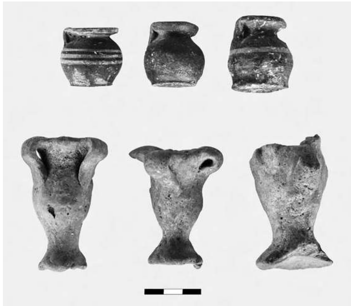
Άμύκλαι. Χαρακτηριστικά μικκύλα αγγεία αρχαϊκής εποχής από τη ΝΔ. πλαγιά του λόφου.

ό ανασκαφεύς συμπεραίνει ότι ή επίχωση τών γεωμετρικῶν χρόνων ἀποτελοῦσε καὶ ἀποθέτη τών τότε καταλοίπων τῆς λατρείας τών Ὑακινθίων.