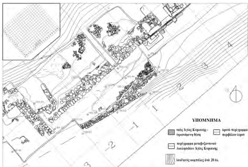
Άμύγλαι. Σχεδιαστική αποτύπωση τῆς ΝΔ. πλαγιᾶς τοῦ λόφου τῆς Ἁγίας Κυριακῆς.