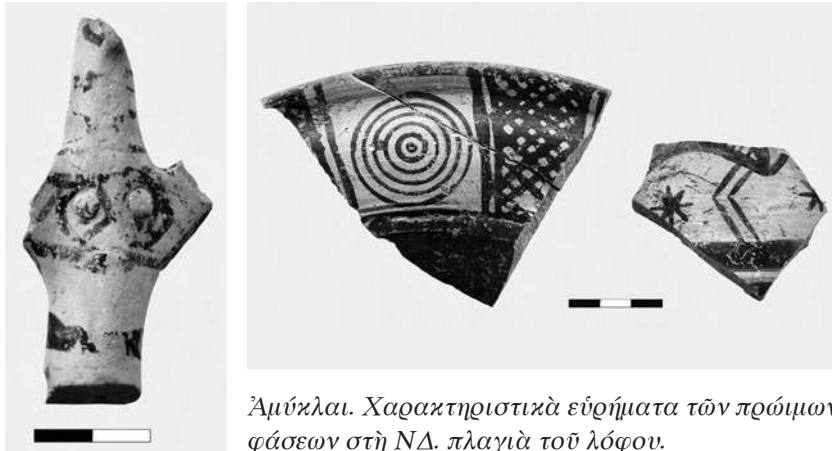
Ἀμύκλαι. Χαρακτηριστικὰ εὐρήματα τῶν πρώιμων φάσεων στὴ ΝΔ. πλαγιά τοῦ λόφου.

τῶν γεωμετρικῶν χρόνων, κοινῆς τοιχοδομίας, τοῦ ὁποίου τὸ ἀνώτερο μέρος, φθειρόμενο μὲ τὴν πάροδο τοῦ χρόνου, ἐπισκευαζόταν ὅταν ὁ χώρος χρησίμευε πλέον γιὰ καλλιέργεια. Οἱ ἐπιχώσεις ποὺ συγκρατεῖ ὁ τοῖχος ἦσαν, στὸ κατώτερο στρώμα, τῆς ὕστερης Χαλκοκρατίας, μὲ θραύσματα μυκηναϊκῶν εἰδωλίων τύπου Ψ καὶ ὄστρακα γεωμετρικῶν χρόνων (μὲ ὁμόκεντρος κύκλους, πουλιά). Ἀπὸ τὸ πλῆθος τῶν εὐρημάτων