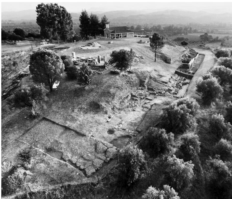
Εικ. 8. Ἀεροφωτογραφία τῆς νότιας πλαγιᾶς τοῦ λόφου τῆς Ἁγίας Κυριακῆς. Λήψη ἀπὸ Δ.