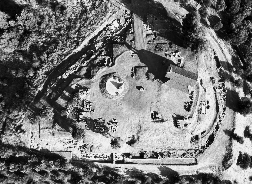
Είχ. 1. Γενική άποψη του ιερού.