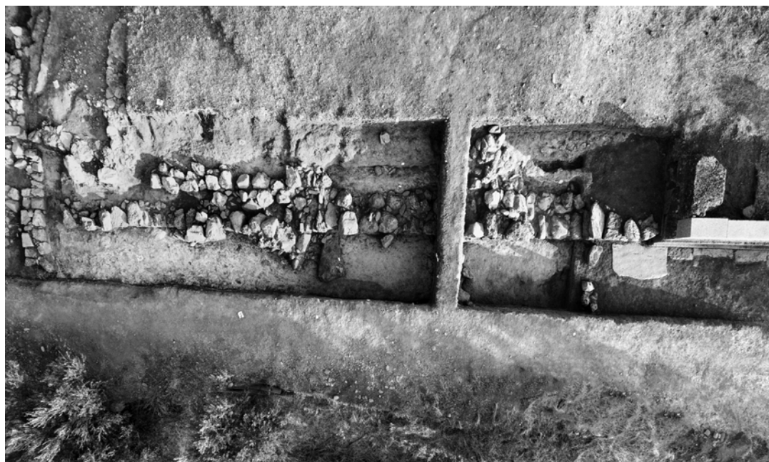
3α-β. Ο ύστερογεωμετρικός περίβολος.