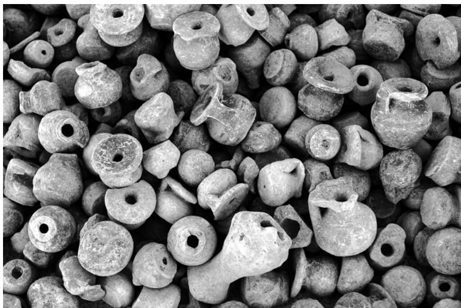
Εἰκ. 4. Λεπτομέρεια τοῦ πλήθους τῶν μικρῶν ἀγγείων πού βρέθηκαν ἀμέσως μπροστά ἀπὸ τὸν πρώιμο περίβολο.