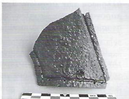
Αμύνκλαι. Χαρακτηριστικά εύρηματα μπροστά από τον τοίχο.