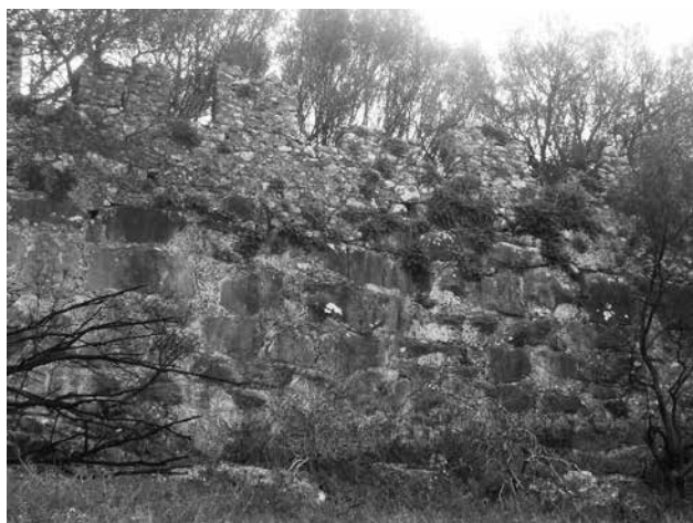
Εικ. 102. Γύθειο. Κάστρο Πασσαβά. Βόρεια πλευρά του τείχους, ανατολικά της πύλης. Διακρίνεται το αρχαίο τμήμα του τείχους, επί του οποίου κατασκευάστηκε η μεσαιωνική προσθήκη.

χών διατηρείται σε μεγάλη έκταση (60-80 μ. περίπου εκατέρωθεν της πύλης) το αρχαίο τμήμα του τείχους, αποτελούμενο από μεγάλους βραχόλιθους αδρά ειργασμένους, χωρίς χρήση συνδετικού υλικού (Εικ. 101). Σε ορισμένα σημεία υπάρχουν λιθόπλινθοι τοποθετημένες κατά το ψευδοϊσόδομο ή πολυγωνικό σύστημα. Συνδετικό υλικό, όπου υπάρχει, είναι σαφές ότι προστέθηκε μεταγενέστερα, κατά τη μετασκευή και επέκταση του τείχους στους μεσαιωνικούς χρόνους (Εικ. 102). Αξίζει να σημειωθεί ότι εντοπί-