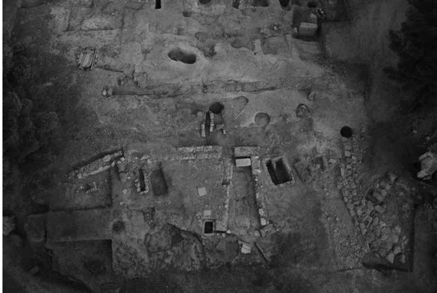
Εικ. 106. Αμύκλες. Ιερό Αμυκλαίου Απόλλωνος. Η περιοχή της πύλης του ιερού.

ων. Αμέσως δυτικά του και σε επαφή με αυτό ανασκάφηκε μέρος από την υποθεμελίωση μιας άλλης ισχυρής κατασκευής που, κατά τα φαινόμενα, καταλαμβάνει τετράγωνη έκταση, μήκ. και πλ. 4,50 μ. περίπου. Πρόκειται πιθανότατα για ένα οικοδόμημα που ενίσχυε τον περίβολο και την είσοδο του ιερού.