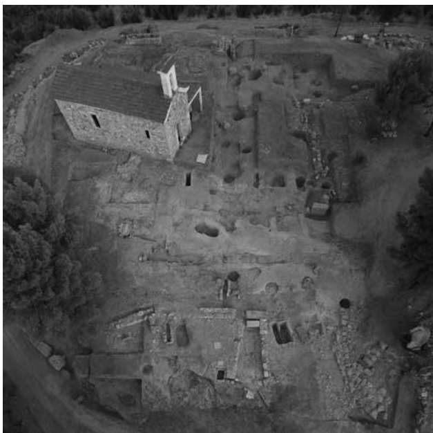
Εικ. 105. Αμύκλες. Ιερό Αμυκλαίου Απόλλωνος. Το βόρειο τμήμα του ιερού.

σικού εδάφους, μήκ. 10 και πλ. 2,50 μ. περίπου (Εικ. 105). Αυτή οφείλεται αφενός σε αρχαίες και νεότερες επεμβάσεις και αφετέρου στην αναμόχλευση των χωμάτων από τις ρίζες των δέντρων που υπήρχαν εκεί. Η διάνοιξη της όμως πρέπει να σχετίζεται κυρίως με τις ανασκαφές που πραγματοποίησε εδώ το 1925 ο E. Buschor 63 . Την επίχωση των τετραγώνων της περιοχής χαρακτηρίζει η ιδιαίτερα διαταραγμένη στρωματογραφία.