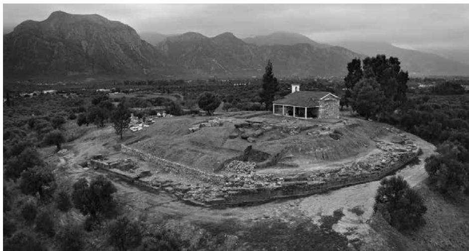
Εικ. 107. Αμύκλες. Ιερό Αμυκλαίου Απόλλωνος. Άποψη του λόφου της Αγίας Κυριακής από ΝΔ. Διακρίνεται η απολάξευση του πορώδους βράχου για τη δημιουργία ανδρών και την ανέγερση περιβόλων γεωμετρικής και αρχαϊκής εποχής.

νται από την τελική νεολιθική, την πρωτοελλαδική και τη μεσοελλαδική περίοδο. Όπως σημειώθηκε σε παλαιότερες αναφορές, η απουσία της μυκηναϊκής περιόδου είναι αξιοπρόσεκτη· μετά από μια περίοδο εγκατάλειψης, υπάρχουν ενδείξεις για την επανεκκίνηση των ανθρώπινων δραστηριοτήτων από την πρωτογεωμετρική περίοδο και μετά. Το υπό μελέτη υλικό προέρχεται από μια σειρά δοκιμαστικών τομών που ανοίχθηκαν σε διάφορα σημεία της κορυφής και των βόρειων πλαγιών της ακρόπολης το 1997 και από το Κτήμα 17, όπου διεξήχθησαν πιο συστηματικές ανασκαφές μεταξύ του 1999 και του 2009.