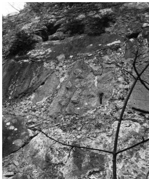
Εικ. 103. Γύθειο. Κάστρο Πασσαβά. Βόρεια πλευρά του τείχους, ανατολικά της πύλης. Αρχαίο αρχιτεκτονικό μέλος με πελεκίνο σύνδεσμο εντοιχισμένο στο τείχος.

χών διατηρείται σε μεγάλη έκταση (60-80 μ. περίπου εκατέρωθεν της πύλης) το αρχαίο τμήμα του τείχους, αποτελούμενο από μεγάλους βραχόλιθους αδρά ειργασμένους, χωρίς χρήση συνδετικού υλικού (Εικ. 101). Σε ορισμένα σημεία υπάρχουν λιθόπλινθοι τοποθετημένες κατά το ψευδοϊσόδομο ή πολυγωνικό σύστημα. Συνδετικό υλικό, όπου υπάρχει, είναι σαφές ότι προστέθηκε μεταγενέστερα, κατά τη μετασκευή και επέκταση του τείχους στους μεσαιωνικούς χρόνους (Εικ. 102). Αξίζει να σημειωθεί ότι εντοπί-