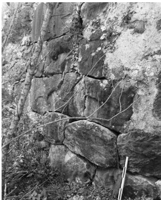
Εικ. 101. Γύθειο. Κάστρο Πασσαβά. Βόρεια πλευρά του τείχους, δυτικά της πύλης. Αρχαίο τμήμα του τείχους δομημένο εν ξηρώ.