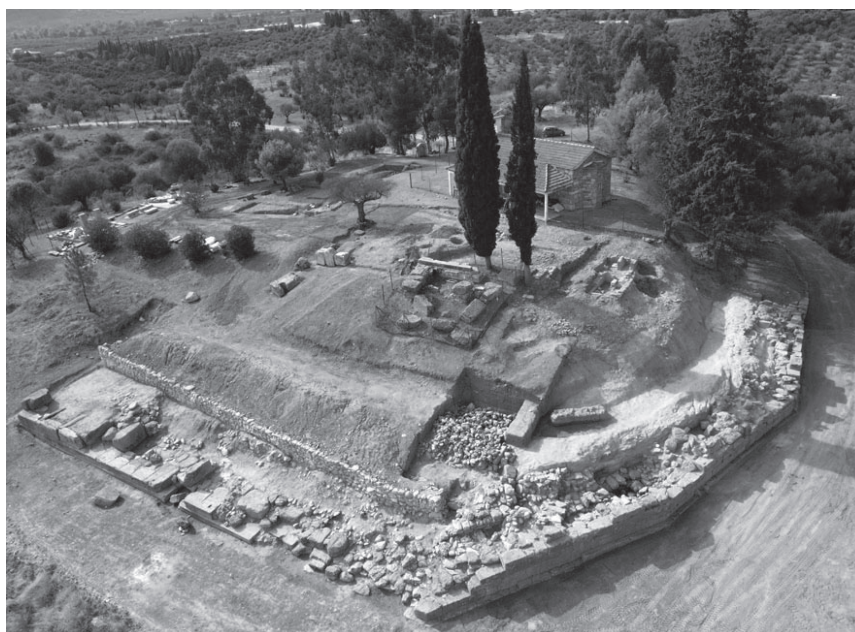
Εικ. 112. Αμύκλες. Ιερό Αμφικλαίου Απόλλωνος. Τα δύο άνδρηρα, που περιβάλλουν το λόφο ημικυκλικά από Ν. και ανατολικά προς Β. και σχετίζονται με την κατασκευή των δύο περιβόλων στο χαμηλότερο επίπεδο του λόφου.