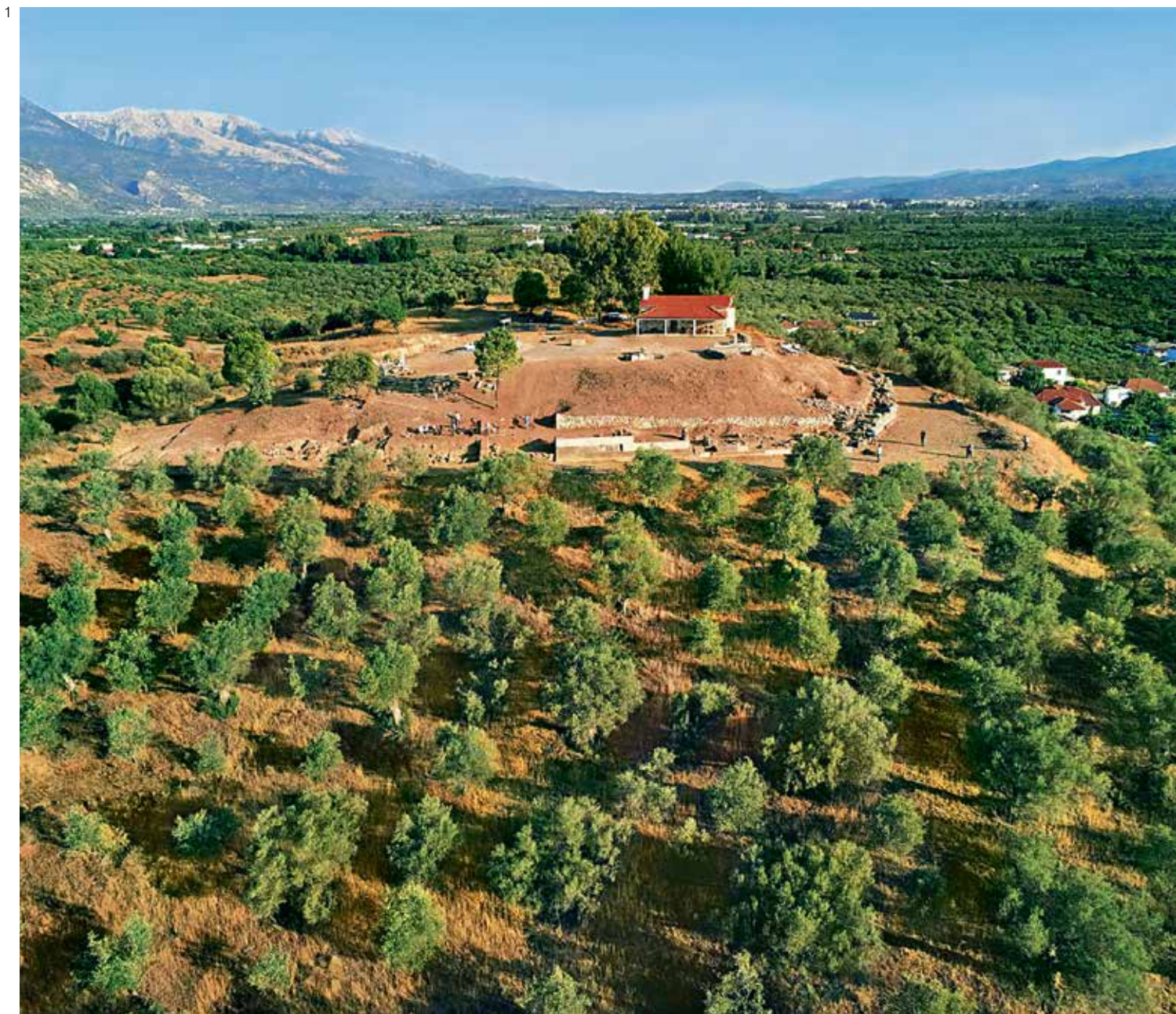
1. Ο αρχαιολογικός χώρος του Αμκλαίου