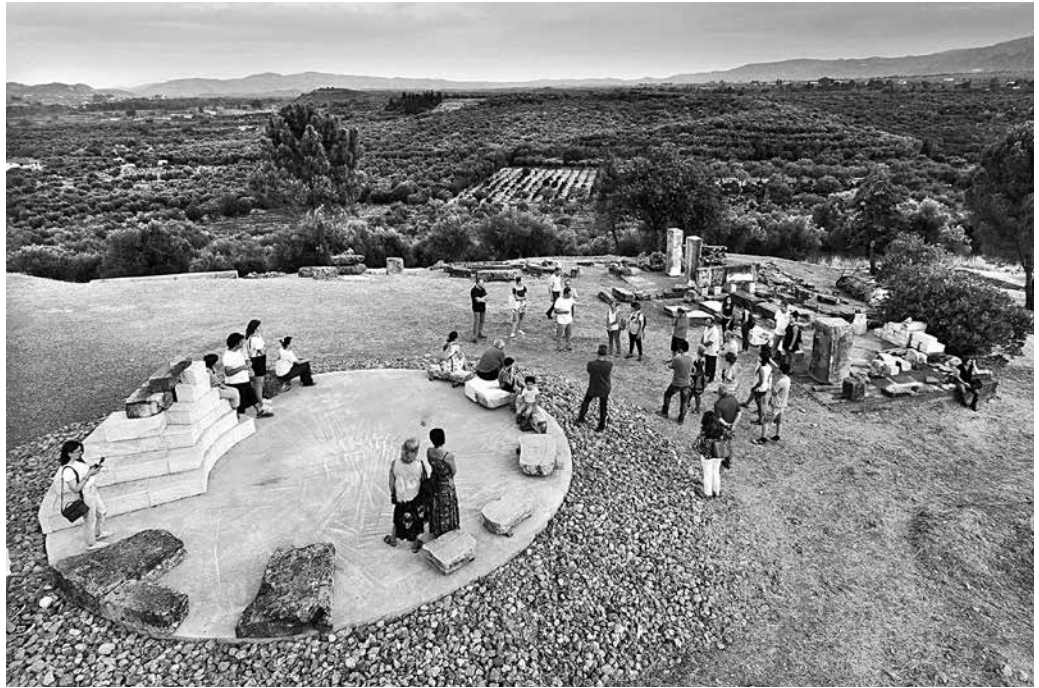
2. Στιγμιότυπο από θεματική ξενάγηση στο Αμυκλαίο

να συνδέεται στενά με το κοινωνικό περιβάλλον, δημιουργώντας μια μορφή βιωματικής εμπειρίας μέσα από την παραγωγή ενός διαλεκτικού πλαισίου. Επιπλέον, χρειάζεται να ωθεί τον επισκέπτη σε μια διανοητική διαδικασία, όχι μόνο διαχρονικά για τον χώρο και την ιστορία του, αλλά μέσα από «νησίδες ατομικών εμπειριών» που θα λειτουργούν ως βοηθήματα για την «αναγνώρισή» του 17 . Η προσέγγιση αυτή είναι απαραίτητη, ώστε να μετατραπεί το αρχαιολογικό-πολιτιστικό τοπίο σε έναν βιώσιμο θεσμό, που εμπλέκεται ενεργά στη ζωή της κοινότητας, δημιουργεί μόνιμους δεσμούς με το κοινό, βελτιώνει την πρόσβαση και ενθαρρύνει τη μεγαλύτερη συμμετοχή από την κοινότητα 18 .