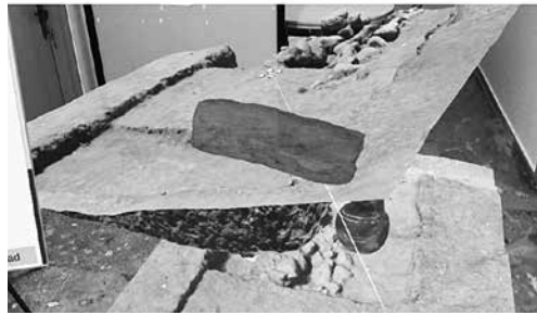
10. Τρισδιάστατο μοντέλο μικτής πραγματικότητας της ανασκαφικής διαδικασίας στο Αμυκλαίο (φωτ. αρχείο Ερευνητικού Προγράμματος Αμυκλών)

των εφαρμογών εκπαιδευτικού πολιτιστικού τουρισμού με τη χρήση τεχνικών μικτής πραγματικότητας, επαυξημένης πραγματικότητας και παιχνιοποίησης, μέσα από την αξιοποίηση νέων μεθόδων τεκμηρίωσης της ανασκαφικής διαδικασίας και των ευρημάτων (εικ. 10). Στόχος του έργου είναι να προσφέρει νέες δυνατότητες στους αρχαιολόγους και επισκέπτες του χώρου (κατά χώραν ή διαδικτυακά) με τη χρήση των κατάλληλων οπτικών μέσων μικτής πραγματι-