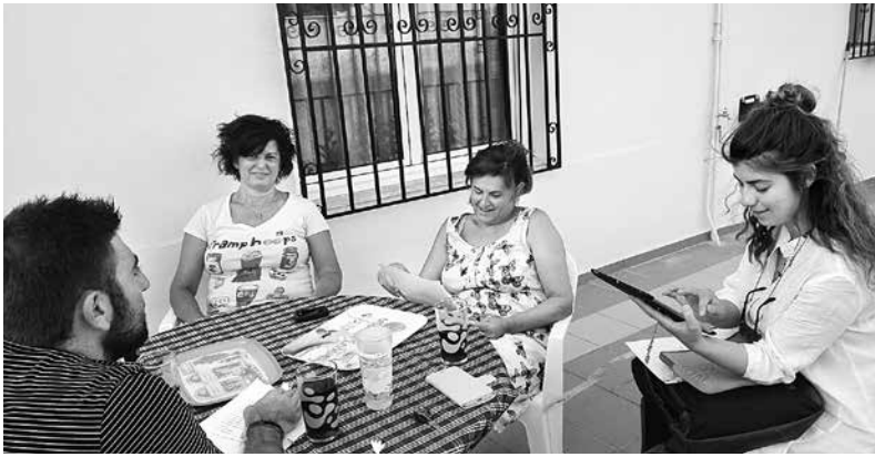
8. Έρευνα κοινού στην κοινότητα Αμυκλών

είχαν την ευκαιρία να εκφράσουν τους προβληματισμούς τους σχετικά με τις παρεμβάσεις που μπορούν να γίνουν στη μορφή του μελλοντικού αρχαιολογικού πάρκου (εικ. 4) 44 . Επιπλέον, οι συμμετέχοντες, αφού ενημερώθηκαν για την διαμόρφωση του λόφου της Αγ. Κυριακής, είχαν την ευκαιρία να γνωρίσουν «καλές πρακτικές» από αντίστοιχες πρωτοβουλίες, όπως αυτή της Αρχαίας Μεσσήνης, και να εκφράσουν τους προβληματισμούς και τις προτάσεις τους, τις οποίες το Ερευνητικό Πρόγραμμα Αμυκλών προσπαθεί να στηρίξει και να μεταφέρει στην εκ του νόμου αρμόδια για αυτό το θέμα υπηρεσία, την Εφορεία Αρχαιοτήτων Λακωνίας (εικ. 5).